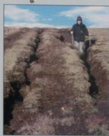
Akstur utan vega getur valdið miklu þjófvegum. Off-road driving can induce dramatic soil erosion.