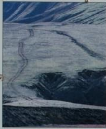
Sár vegna aksturs utan vega geta þuffi hella ólí á grás. Damages from off-road driving can take a century to heal.