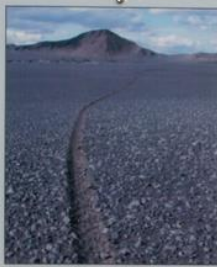
Hótt sandur fjök í Bláa nær hvern akstur að hlyta þess. Tracks in the gravel will not be cured by drifting sand.